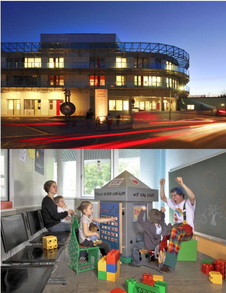
Abbildung: Außenansicht (Eingang) Cnopf'sche Kinderklinik und Wartebereich der Kindernotaufnahme

Im Herzen der Metropolregion Nürnberg befinden sich die Cnopf'sche Kinderklinik und die Klinik Hallerwiese unter einem Dach in Trägerschaft der Diakonie Neuendettelsau. Die beiden Nürnberger Kliniken haben zusammen 315 Betten und sind im Krankenhausplan des Freistaates Bayern aufgenommen. Die Cnopf'sche Kinderklinik selbst betreibt 145 Betten mit dem Versorgungsauftrag als Fachkrankenhaus. Am Klinikum Ansbach besteht eine Dependence mit 10 Betten.